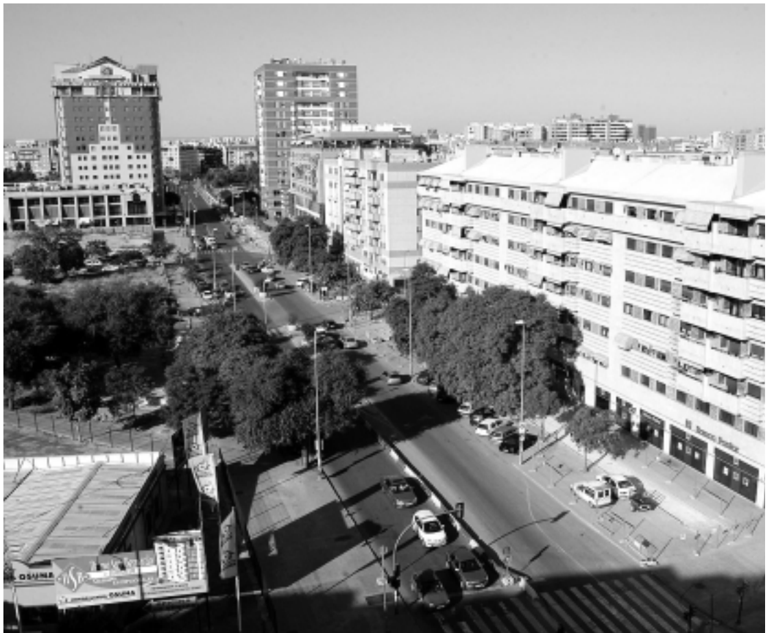
La Torre de la Buhaira y el hotel gemelo Sevilla Center destacan en el perfil del caserío.

Precisamente el barrio que da nombre al distrito se ha convertido en un nuevo centro comercial y empresarial que, lejos de agotarse, ejerce un efecto llamada que influye en el aumento de los precios en alquiler y venta de la planta de oficinas y en la revalorización de los locales comerciales. El traslado al Oriente de los grandes hoteles, los edificios empresariales y los principales núcleos comerciales ha sufrido este mandato la incomodidad deriva-